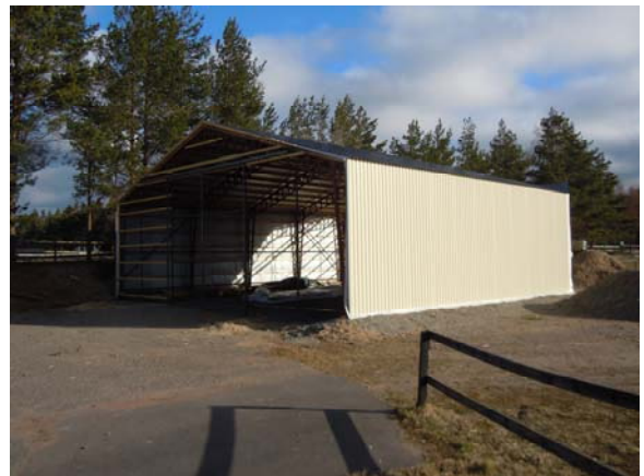
Vår nya hall.

All övrig info såsom kommande möten, arbetsdagar, tävlingar, kontaktpersoner m.m finns på vår hemsida.