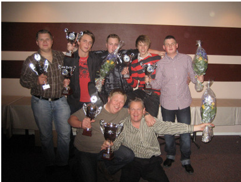
Glada FMK:are på prisfesten i Jönköping.